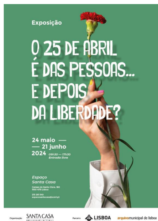
Figura 3: Cartaz da exposição da SCML

A SCML também realizou uma exposição com o título “O 25 de abril é das pessoas: E depois da liberdade?” no Espaço Santa Casa, entre 24 de maio e 21 de junho 2024, que contou com documentos recolhidos no âmbito deste projeto e fotografias do AML cedidas para o efeito (figura 3).