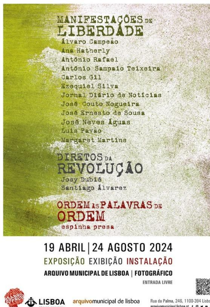
Figura 2 Apresentação das três principais iniciativas realizadas no AML/Fotográfico, a exposição, a exibição videográfica e a instalação.

A exposição de fotografia Manifestações de Liberdade , patente ao público no AML/fotográfico, entre abril e agosto, deu a conhecer as manifestações culturais, registadas após o 25 de Abril por fotógrafos de diversas coleções à guarda do Arquivo. Para visitantes cegos e com baixa visão foram organizadas, pela primeira vez, visitas orientadas com recurso a audiodescrição e a materiais em relevo. No mesmo edifício foi possível visitar Ordem às Palavras de Ordem , uma instalação/publicação concebida com a colaboração do Centro Português de Serigrafia, através da qual o visitante poderia conjugar ideias de participação e de liberdade de expressão, manipulando palavras e slogans que fazem parte da herança de Abril. Também numa sala do mesmo equipamento, passou a projeção videográfica Diretos da Revolução com a apresentação de dois vídeos sobre o olhar da imprensa estrangeira perante os acontecimentos decorridos em Abril de 1974 (figura 2). Foram, ainda, organizadas quatro conversas sobre o tema Manifestações pela palavra , que decorreram entre abril e agosto, na qual participaram vários convidados que partilharam com o público o seu olhar sobre este momento da história do país, vivido na primeira pessoa.