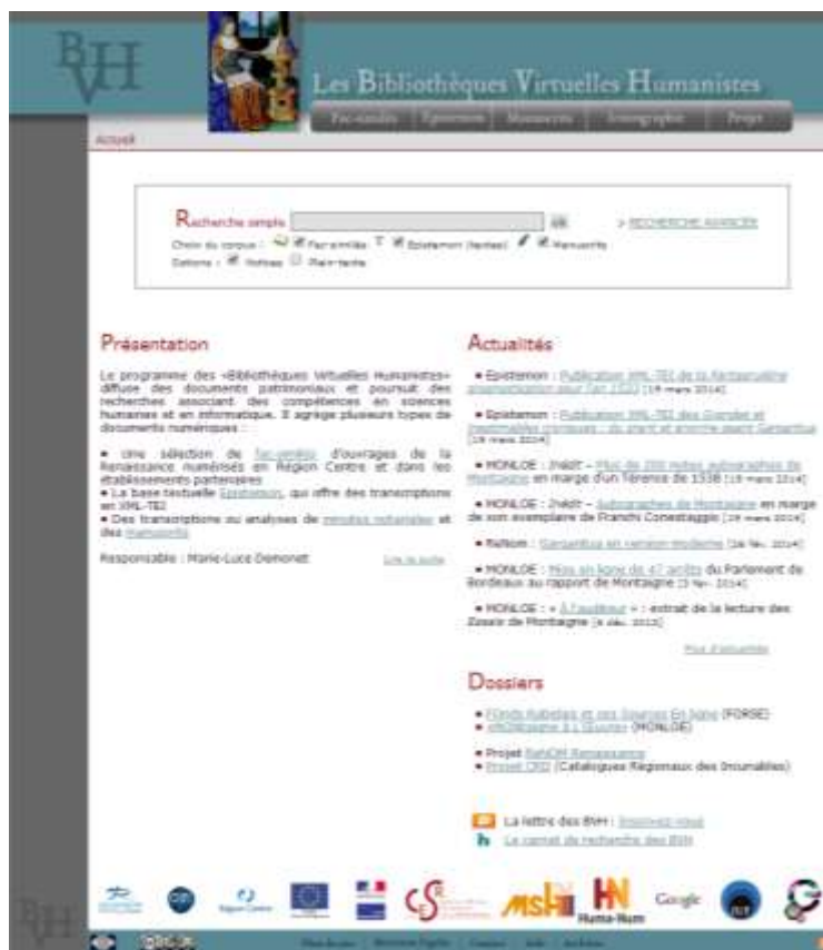
Imagem 3: Bibliothèques Virtuelles Humanistes, página inicial

No Epistemon – Corpus de textos da Renascença (Imagem 4), base de dados textual com transcrição dos documentos para XML-TEI, a pesquisa faz-se por palavra no corpo do texto ou através dos elementos da ficha bibliográfica. A pesquisa cruzada entre os elementos da ficha bibliográfica e a palavra a pesquisar conduz à página, à secção ou ao parágrafo em que a pesquisa se enquadra. As regras utilizadas na transcrição estão disponíveis em linha. Também é possível aceder à obra e ver, em simultâneo, o fac-símile e a respetiva versão textual.