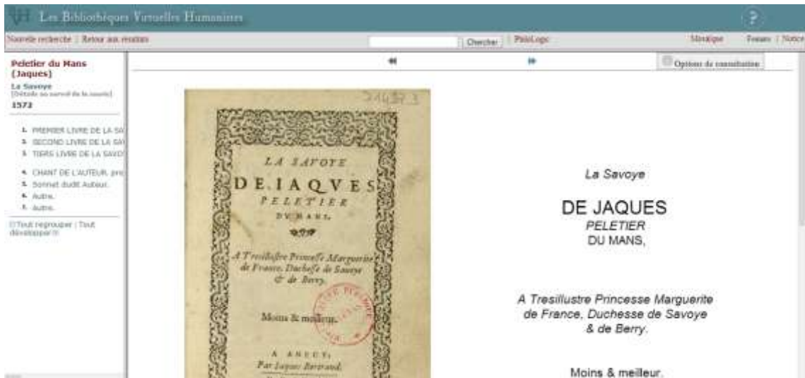
Imagem 4: - Bibliothèques Virtuelles Humanistes, acesso à obra no Epistemon

A OpenEdition, desenvolvida pelo Centre pour l'édition électronique ouverte – CLÉO, unidade que congrega o CNRS, o EHESS, a Universidade Aix-Marseille e a Universidade de Avignon, oferece à comunidade académica uma plataforma internacional de publicação e divulgação da informação em ciências sociais e humanas. É constituída pelas seguintes plataformas: Hypotheses, que alberga blogues denominados cadernos de investigação; Revues, para os periódicos; Calenda, com a agenda e a divulgação de eventos; e os e-book's.