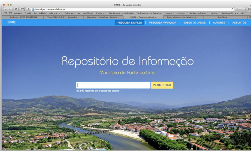
Figura 2 – Páginas de rosto do RIMPL

O repositório conta atualmente com mais de 80 mil registos provenientes de três bases de dados (arquivo, bibliotecas e museus). Um utilizador que se dirija a este portal poderá facilmente pesquisar e recuperar conteúdos armazenados em qualquer uma destas fontes de informação.