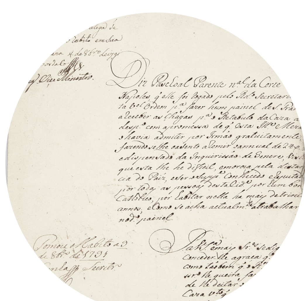
9 - Processo de inquirição de Pascoal Parente (1791).