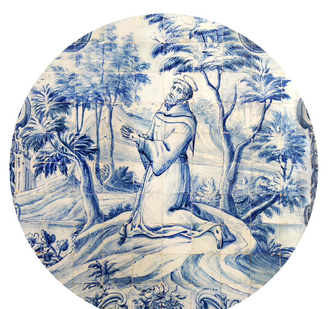
13 - Azulejaria.