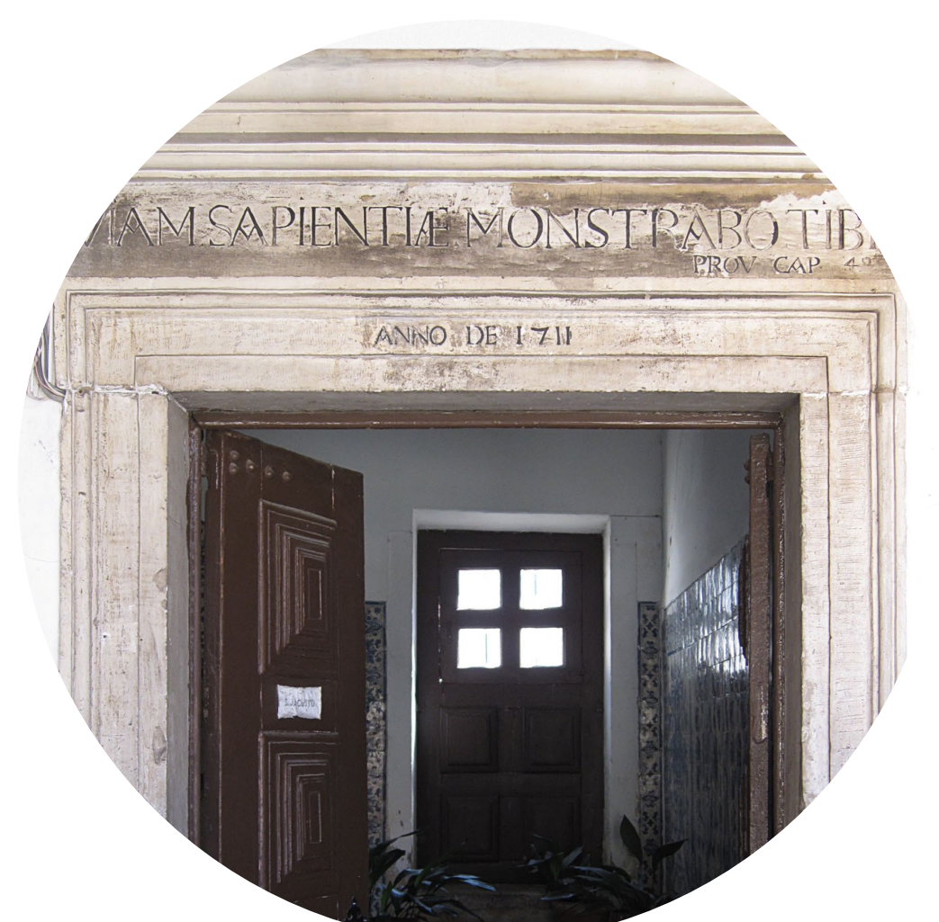
6 - Antiga biblioteca dos frades carmelitas.