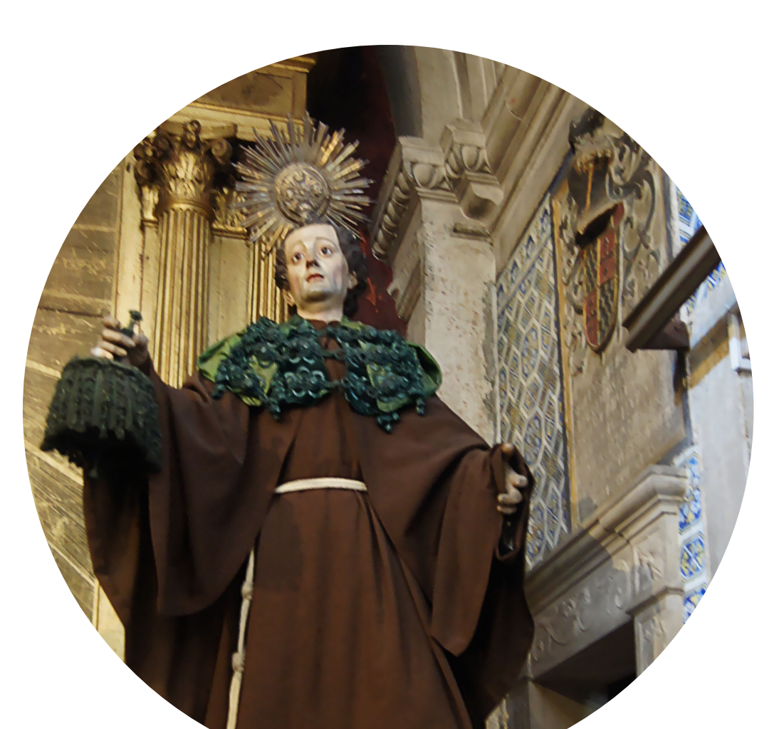
16 - Imagem de roca.