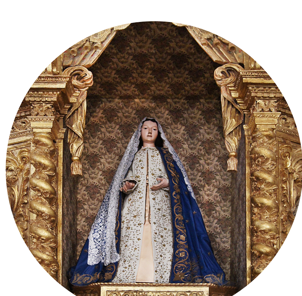
15 - Talha dourada.