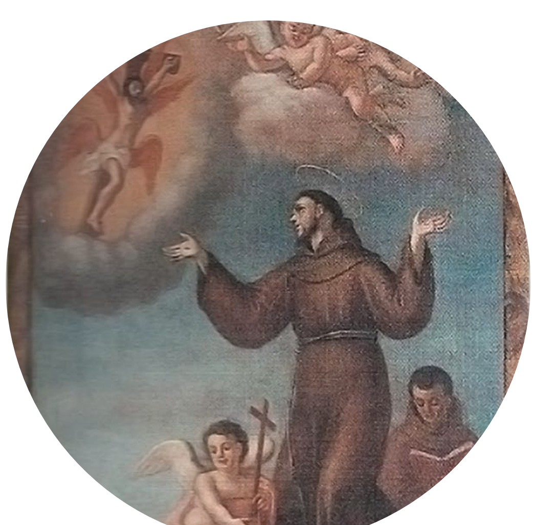
8 - Quadro de autoria de Pascoal Parente.