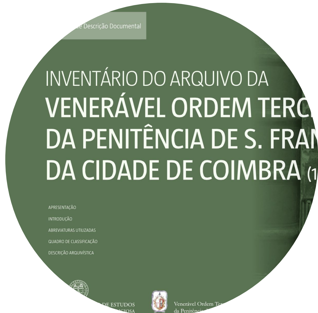
3 - Inventário do Arquivo da Ordem Terceira de S. Francisco de Coimbra.