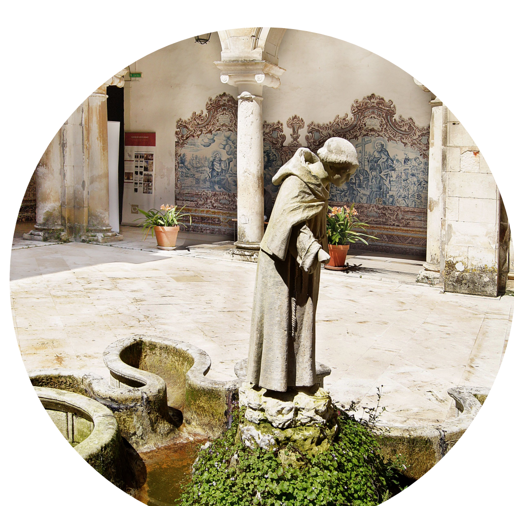
12 - Património artístico e arquitetónico.