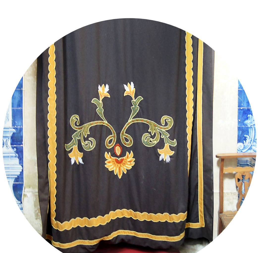
14 - Tapeçaria.