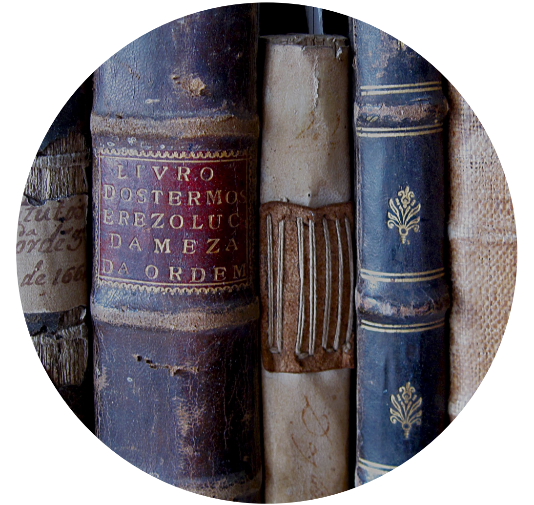
2 - Arquivo da Ordem Terceira de S. Francisco.

O tratamento do Sistema de Informação de Arquivo da Venerável Ordem Terceira de S. Francisco de Coimbra veio permitir, entre outros, a identificação e a contextualização do património artístico e arquitetónico de que a instituição é responsável e pelo qual é responsabilizada.*11e12 As fontes documentais revelaram-se de suma importância para a identificação de peças de arte ou, pelo menos, para a sua contextualização, dando-lhes uma história até então desconhecida. São muitas as peças de arte (pintura, escultura, azulejaria, mobiliário, tapeçaria)*13,14, 15 e 16 que a Venerável Ordem Terceira de Coimbra preserva e o sonho da criação de um museu tem já 20 anos! No entanto, enquanto não se torna realidade, recorre-se ao Sistema de Informação de Arquivo, aos seus documentos, à memória escrita que perdura no tempo, para as identificar, descrever, datar e atribuir uma autoria.