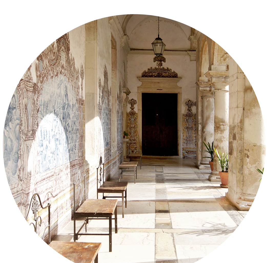
11 - Património artístico e arquitetónico.