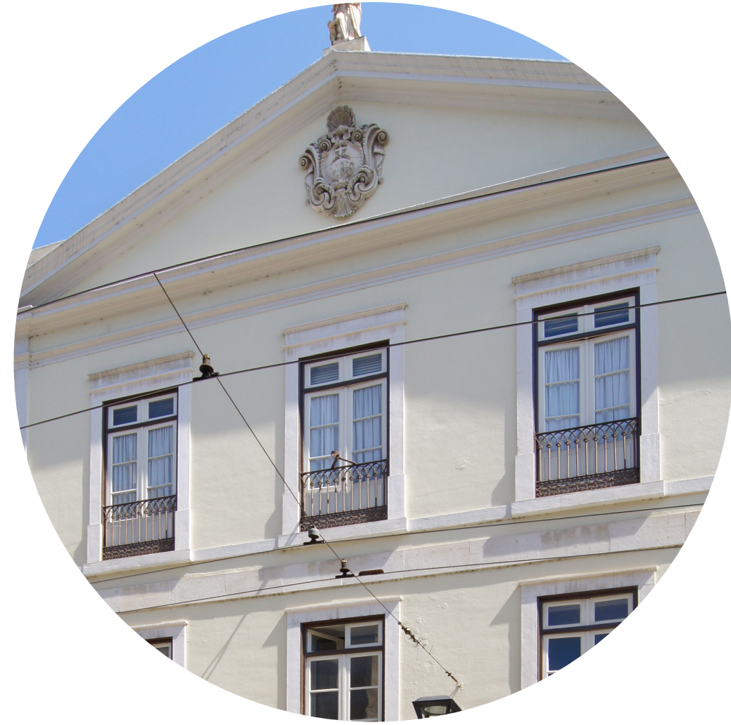
1 - Edifício do Carmo, extinto Colégio Carmelita, Coimbra.

associação portuguesa de bibliotecários, arquivistas e documentalistas