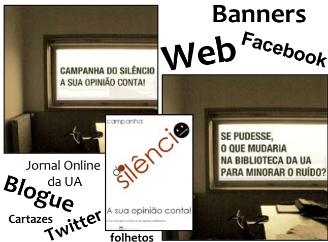
Imagem 1: Materiais realizados na campanha do silêncio e ferramentas de divulgação.