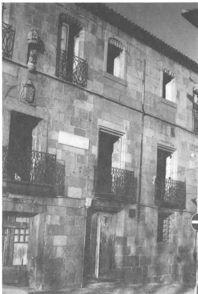
1 - Fachada do edifício do antigo Albergue Distrital