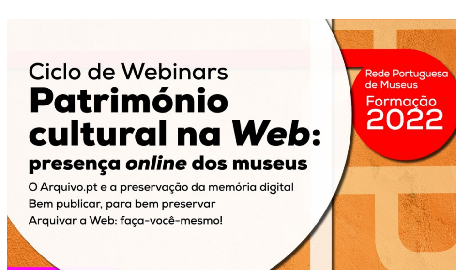
Fig. 4: Ciclo de Webinars organizado pela DGPC