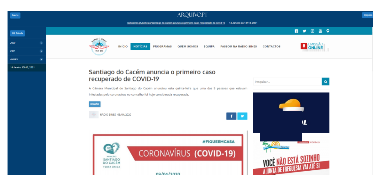
Fig. 5 Página recolhida preservada pelo Arquivo Municipal de Sines