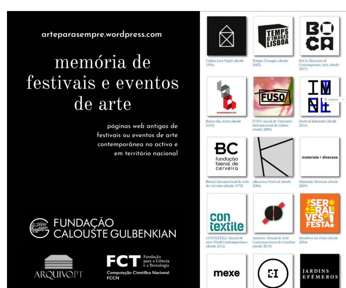
Fig. 3: Projeto PARA SEMPRE com a Biblioteca de Arte da Fundação Calouste Gulbenkian