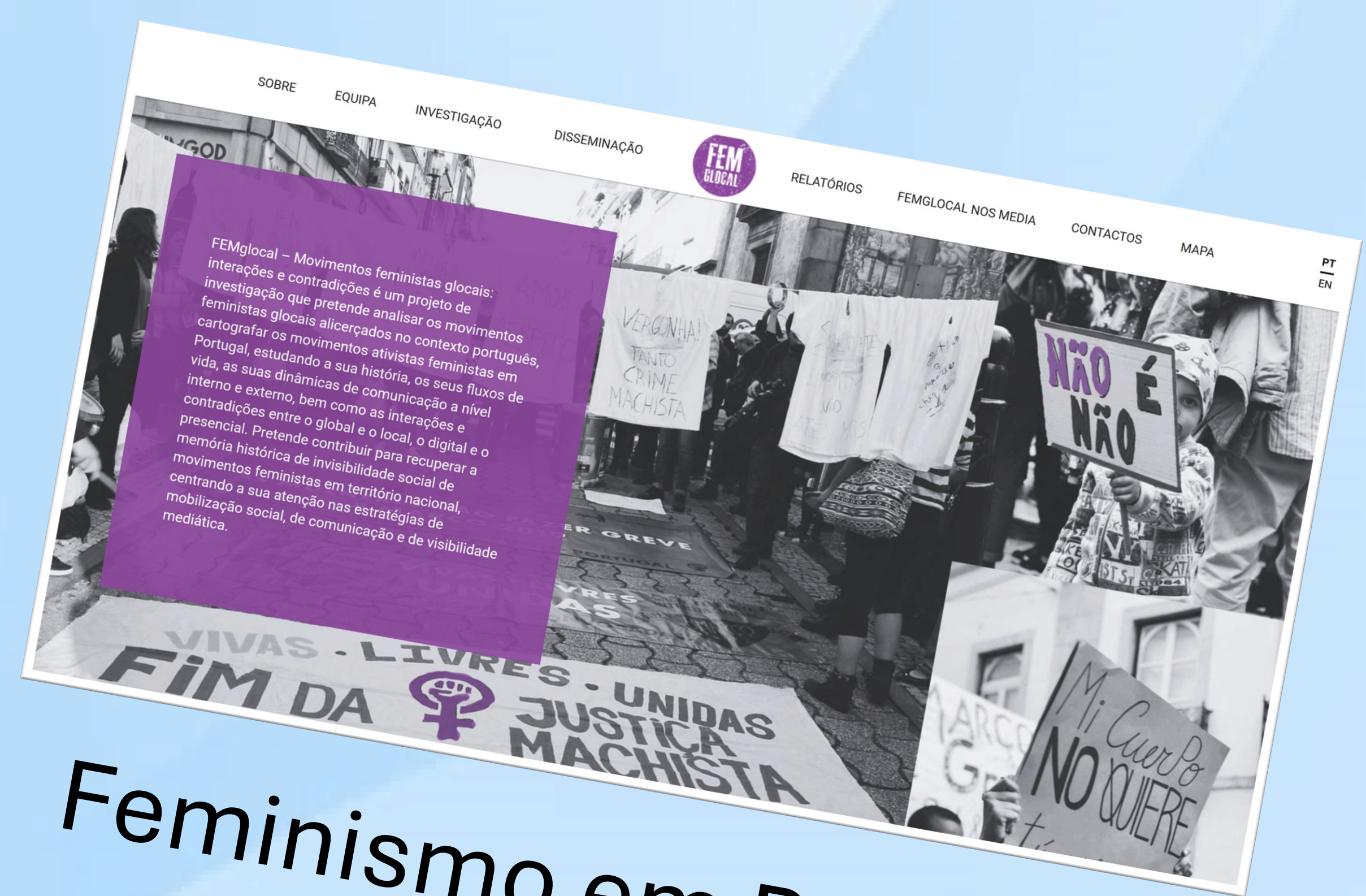
Feminismo em Portugal